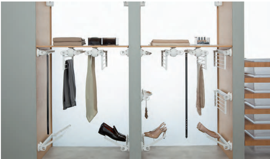
Links oben: Neu im Servetto-Programm ist der Kunststoffbehälter „Roomy“. Links: Die verschiedenen Zubehörteile für Schuhe, Krawatten oder Hosen sorgen für Übersicht

Mehr Ordnung geht nicht: Mit den Systemkomponenten des italienischen Zubehörlieferanten Servetto lässt sich jeder Kleiderschrank individuell auf die eigenen Bedürfnisse einrichten. Im Mittelpunkt steht der Kleiderlift „Servetto“